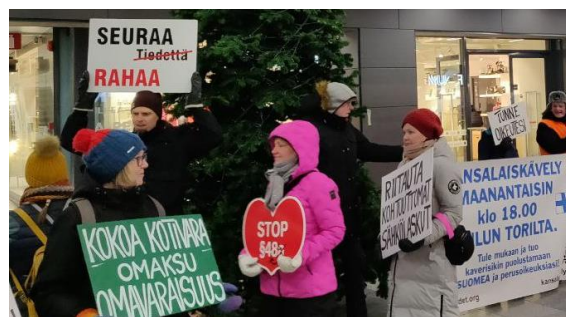
Kuva: Kansalaiskävely Oulussa 9.1.2023

Jos haluat, voit tehdä itsellesi kyltin, jolla ilmaiset epäkohdan tai vaatimuksesi.