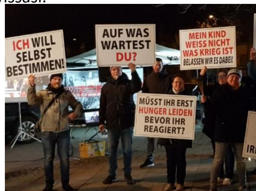
Esimerkki Saksasta. Kyltit suomennettuna: "Haluan päättää itse" "Mitä odotat?" "Lapseni ei tiedä mitä sota on. Olkoon niin jatkossakin" "Pitääkö sinun olla nälkäinen ennen kuin reagoit?"

Kansalaiskävelystä on ilmoitettu Oulun poliisille. Poliisi: OK