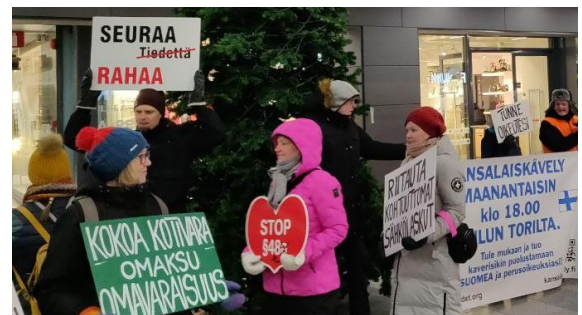
Kuva: Kansalaiskävely Oulussa 9.1.2023

Jos haluat, voit tehdä itsellesi kyltin, jolla ilmaiset epäkohdan tai vaatimuksesi.